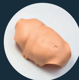
TORSOHAUT (Ref. Chest-PB)