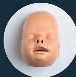
GESICHTSHAUT (Ref. Face-PB)