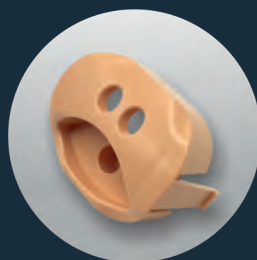
VENTIL (Ref. SP-002 (PB))