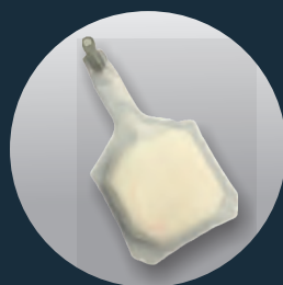
LUNGE (Ref. SP-001 (PB))